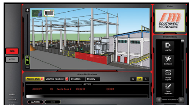
Incorpora gráficos en 2D o 3D de alta resolución en formatos comunes.