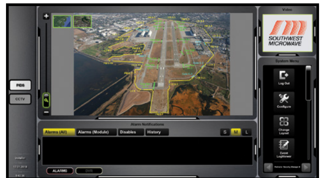
Gerenciamiento en pantalla completa para mapas de sitio.