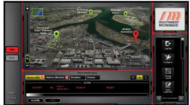
Fácil navegación en el sitio con "portales" configurables.

Las capacidades de manejo de alarmas programables e integración del PSM II, permiten que el sistema de gestión de seguridad tome la mayoría de las decisiones reduciendo el riesgo de error humano. Los dispositivos a ser controlados o monitoreados por el PSM II pueden enlazarse y generar una secuencia de eventos en serie cuando una o más acciones o alarmas ocurran. Por ejemplo, si se recibe una señal de alarma, las cámaras pueden posicionarse a una ubicación pre-programada, se puede enviar un mensaje al personal de seguridad, se pueden abrir o cerrar puertas y se puede activar la grabación de video para capturar el incidente en tiempo real.