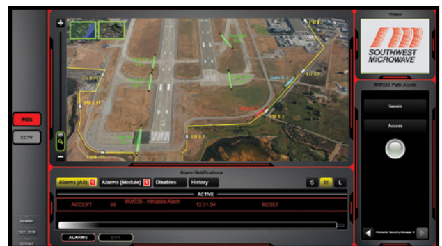
Instrucciones claras en pantalla de manejo de situaciones para los operadores.